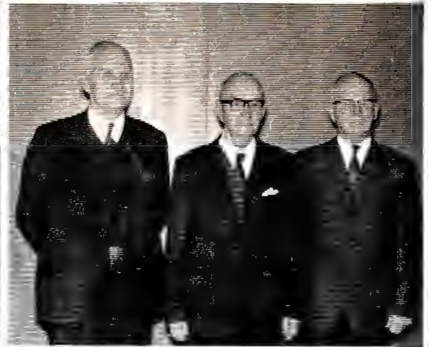
Käkisalmen läänin rykmentin veteraaneja