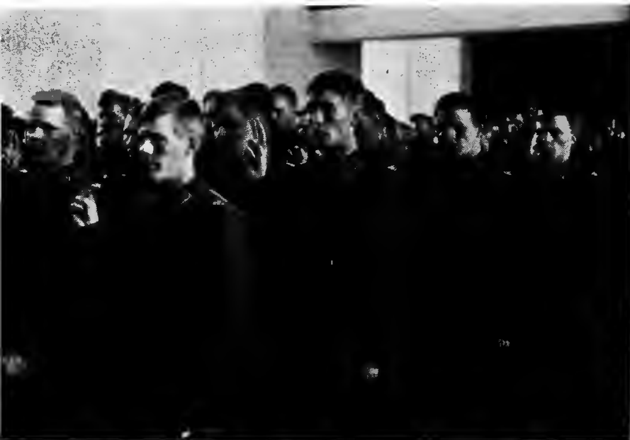
II/72 saapumiserän alokkaat vannovat sotilasvalan Sodankylän kirkossa 27. 7. 72.