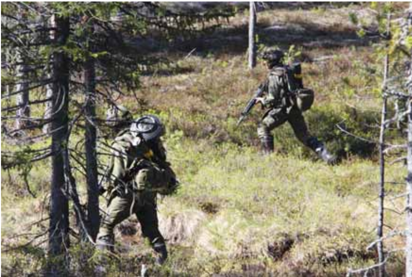
Panssarintuhoajat metsästävät keltaisen vaunua.

Jääkäripataljoona 11 saavutti tavoitteensa Iso Mellavaarassa keskiviikkona ja aloitti puolustusvalmistelut. Raskaan hyökkäysvaiheen jälkeen joukko saatiin jälleen taistelukelpoiseksi, muonaa ja nestettä vietiin huoltopataljoonan toimenpitein joukoille, samalla ampu- matarvikkeet täydennettiin ja joukko oli valmis jatkamaan tehtäväänsä. Saman- aikaisesti keltaisen puolella toteutettiin hyökkäysvalmisteluja. Keltaisen komenta- ja oli päättänyt saada takaisin menettämänsä tärkeän Iso Mellavaaran alueen ja punoi omia suunnitelmiaan.