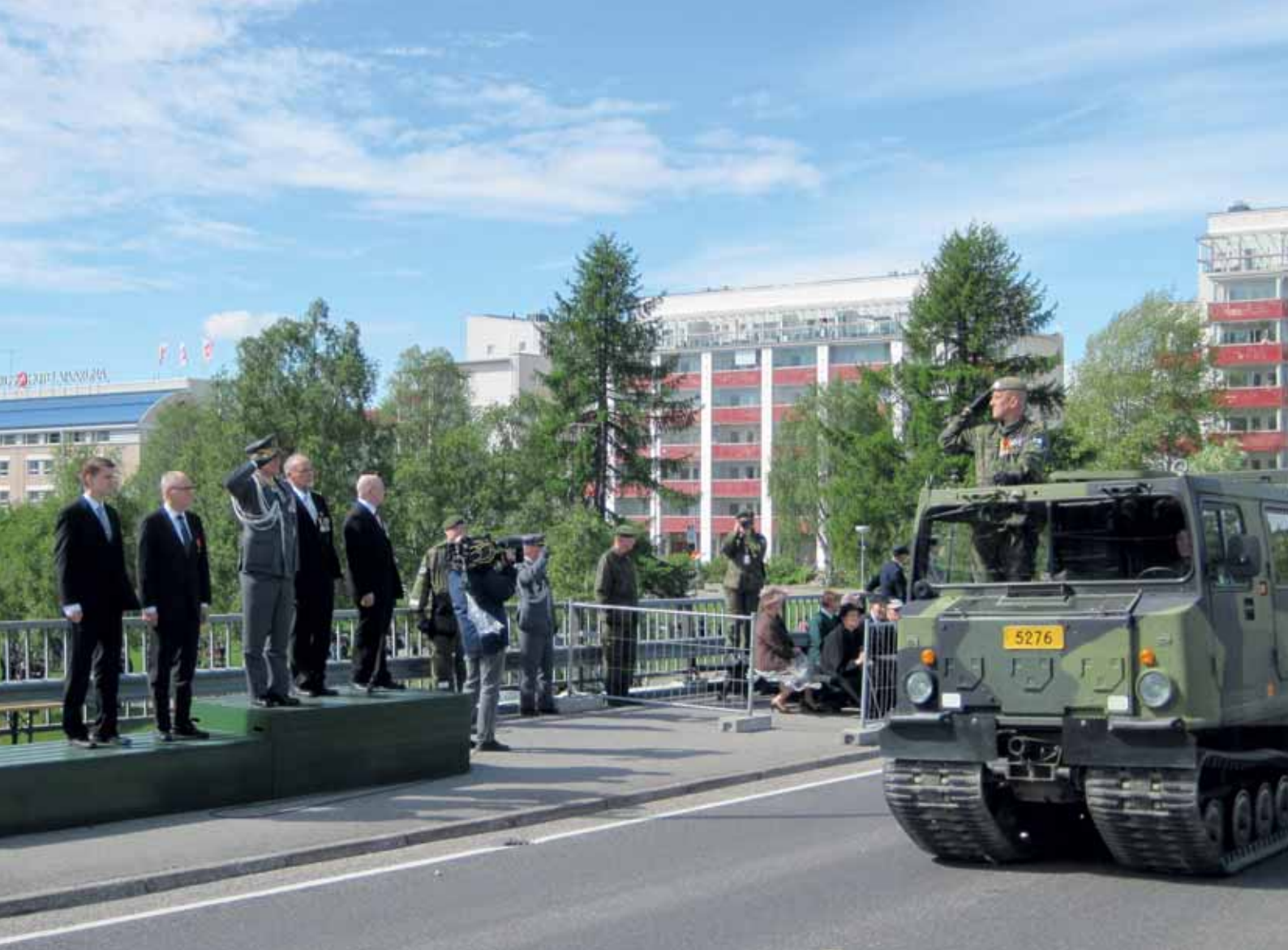
Prikaatin komentaja ohimarssissa Maavoimien komentajan tasalla.