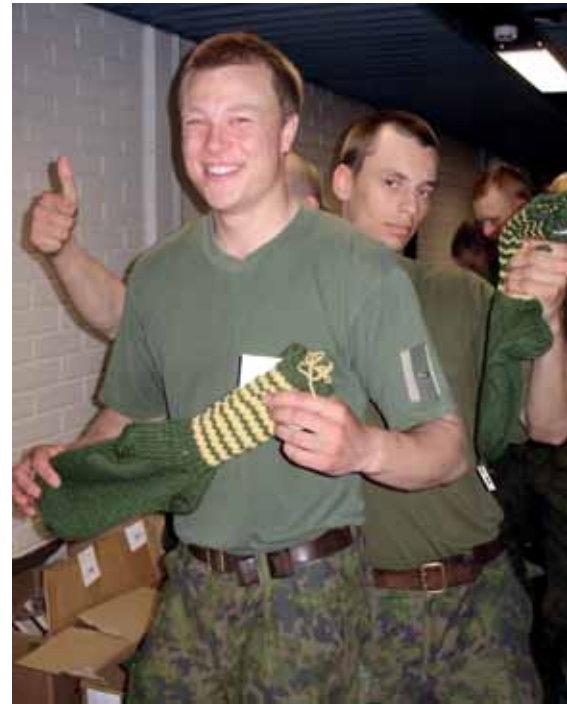
Onnellinen uusien villasukkien omistaja.