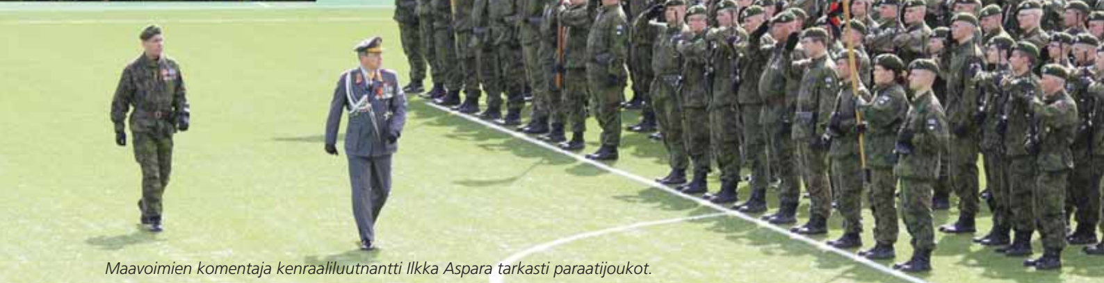
Maavoimien komentaja kenraaliluutnantti Ilkka Aspara tarkasti paraatijoukot.