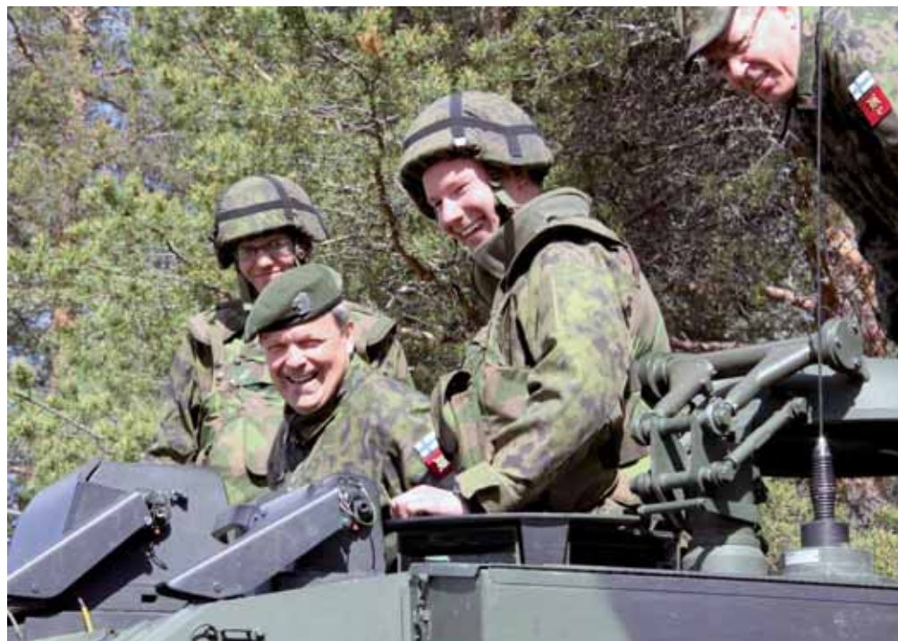
Maavoimien komentaja ja Pohjois-Suomen Sotilasläänin komentaja tyytyväisinä.

Paluumarssit onnistuivat jälleen suunnitellusti ja joukko oli takaisin samassa pisteessä, mistä se aloitti matkansa lauantaina 4.6. Paluun jälkeen jo tutun kuvion mukaan huolto: sotilaat ja kalusto on saatettava taistelukuntoiseksi. Ja jopa toiset viikonloppuvapaa kuntoiseksi.