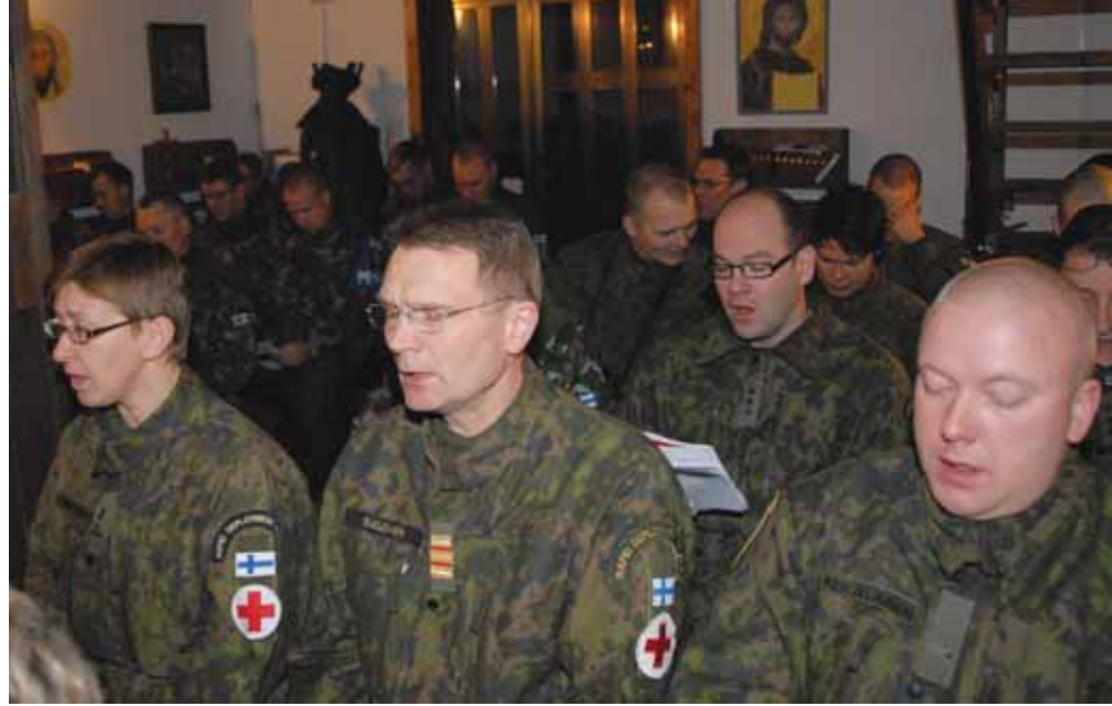
Kauneimmat joululaulut Camp Villen kirkossa.

Vuorovaikutus paikallisten uskonnol-listen johtajien kanssa laittoi pohtimaan sitä, mitä suvaitsevaisuus oikeastaan tar-koittaa. Suvaitsevaisuus ei ole ensisijas-sa samankaltaisuutta tai pyrkimystä sa-mankaltaisuuteen, vaikka yhteiset asi-at ja samankaltaisuus lisäävätkin ihmis-