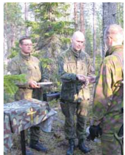
Taistelijat hiljentyivät taistelujen lomassa kenttäehtoiselle.