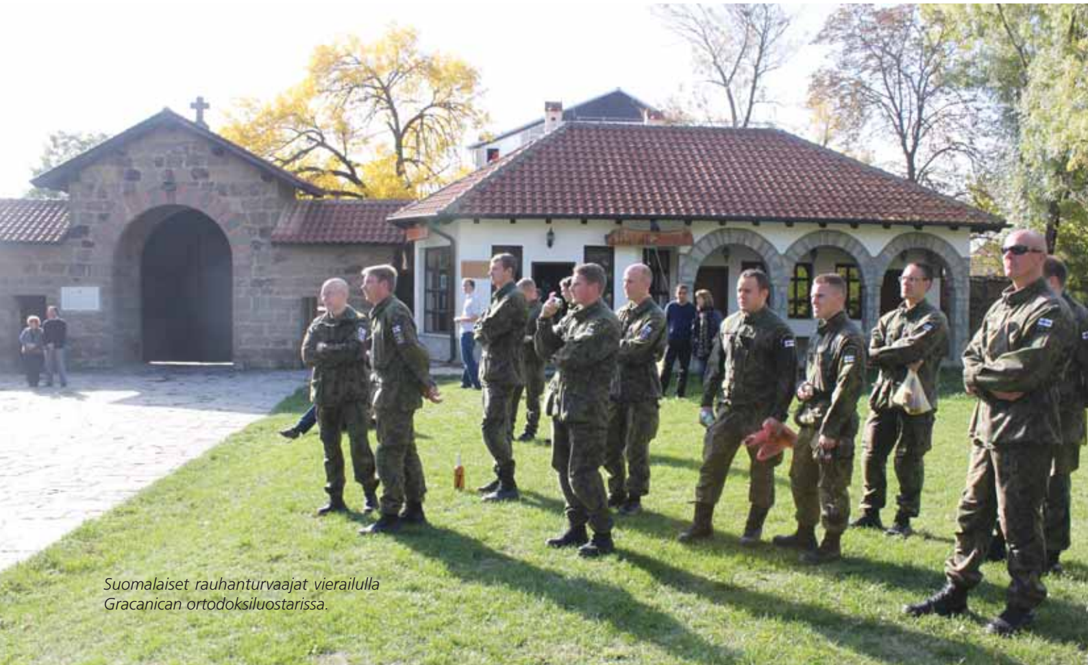
Suomalaiset rauhanturvaajat vierailulla Gracanican ortodoksiluostarissa.