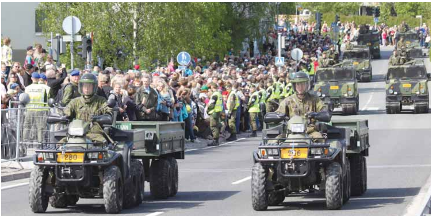
Jääkäriprikaatin joukkoja ohimarssissa.