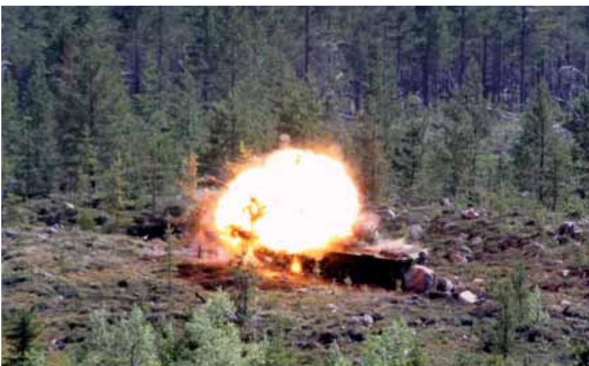
Raskas lähipanssarintorjuntaohjus NLAW.