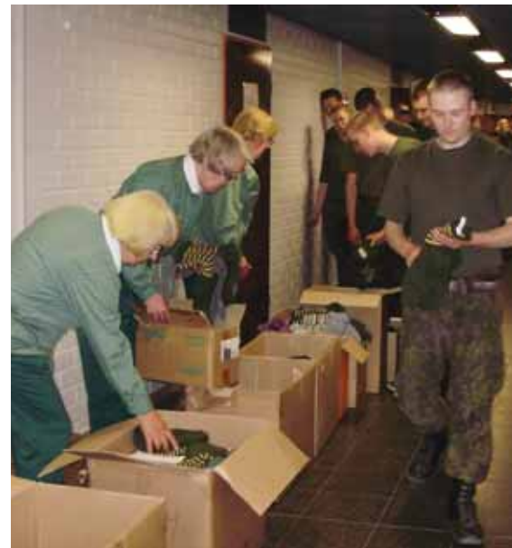
Sukkia jaettiin kaikkiaan neljänä päivänä viidessä yksikössä.