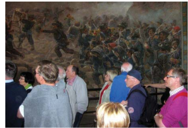
Kiltamatkalaiset tarkastelemassa taistelukuuvia seinämaalauksia Solferinon suuren museotornissa

vat vielä muutaman helteisen tunnin ajan Milanon keskustan nähtävyyksiin. Keskusteltiin myös jo seuraavan kevään kiltamatkasta, jonka kohteeksi on suunniteltu Krimiä.