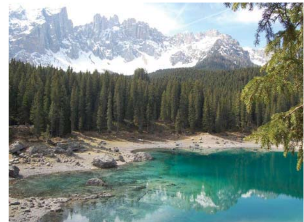
Nämäkin luonnonkauniit vuoristoseudut Dolomiiteilla olivat sotatoimialueina molemmissa maailmansodissa kuten lukuisat kerrat aikaisemminkin vuosisatojen kuluessa. Alppijärvi Karersee eli Lago di Carezza.