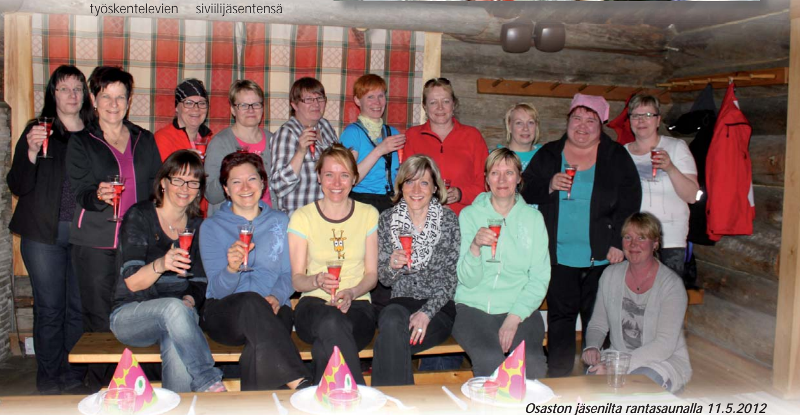
Osaston jäseniltä rantsasaunalla 11.5.2012