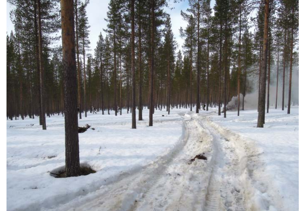
Isku suoritettu, jääkärit irtaantuvat savun suojaossa

Iskun jälkeen molemmat yksiköt saivat tehtävän väistää hiihtäen