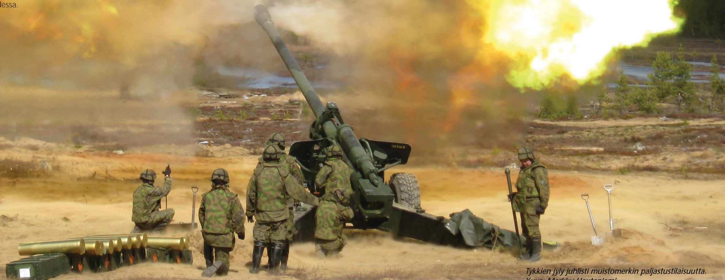
Tykkien jyly juhlisti muistomerkkin paljastustilaisuutta.