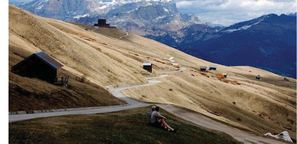
Alppien rinteille Passo Pordoiassa 2 239 metrin korkeudessa olevan hautamonumentin kryptassa on saanut viimeisen leposijansa kaikkiaan 9 429 itävaltalaisia ja saksalaisia sotilasta jotka kaatuivat ensimmäisessä ja toisessa maailmansodassa.