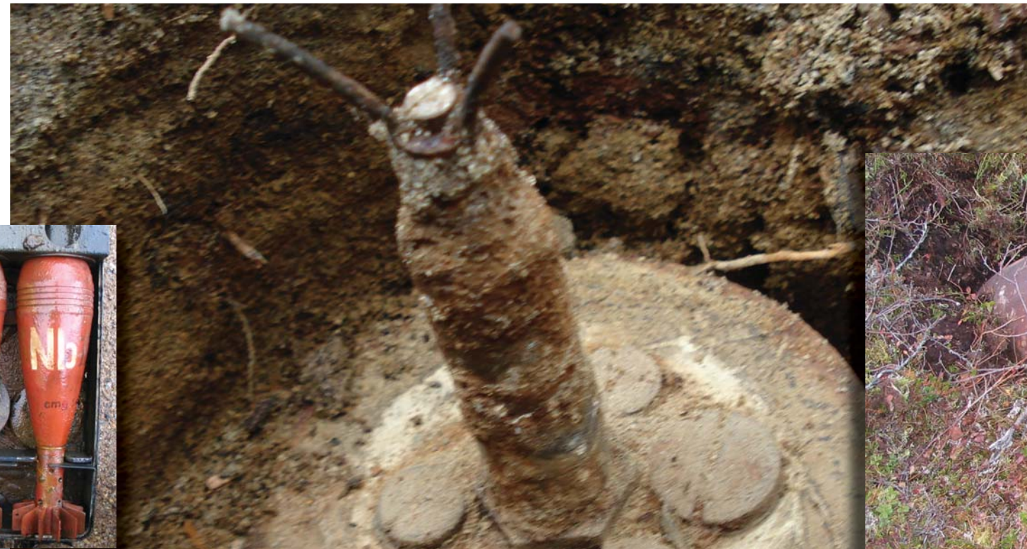
Saksalainen 250 kg lentopommi ja elaz sähkösytytin.