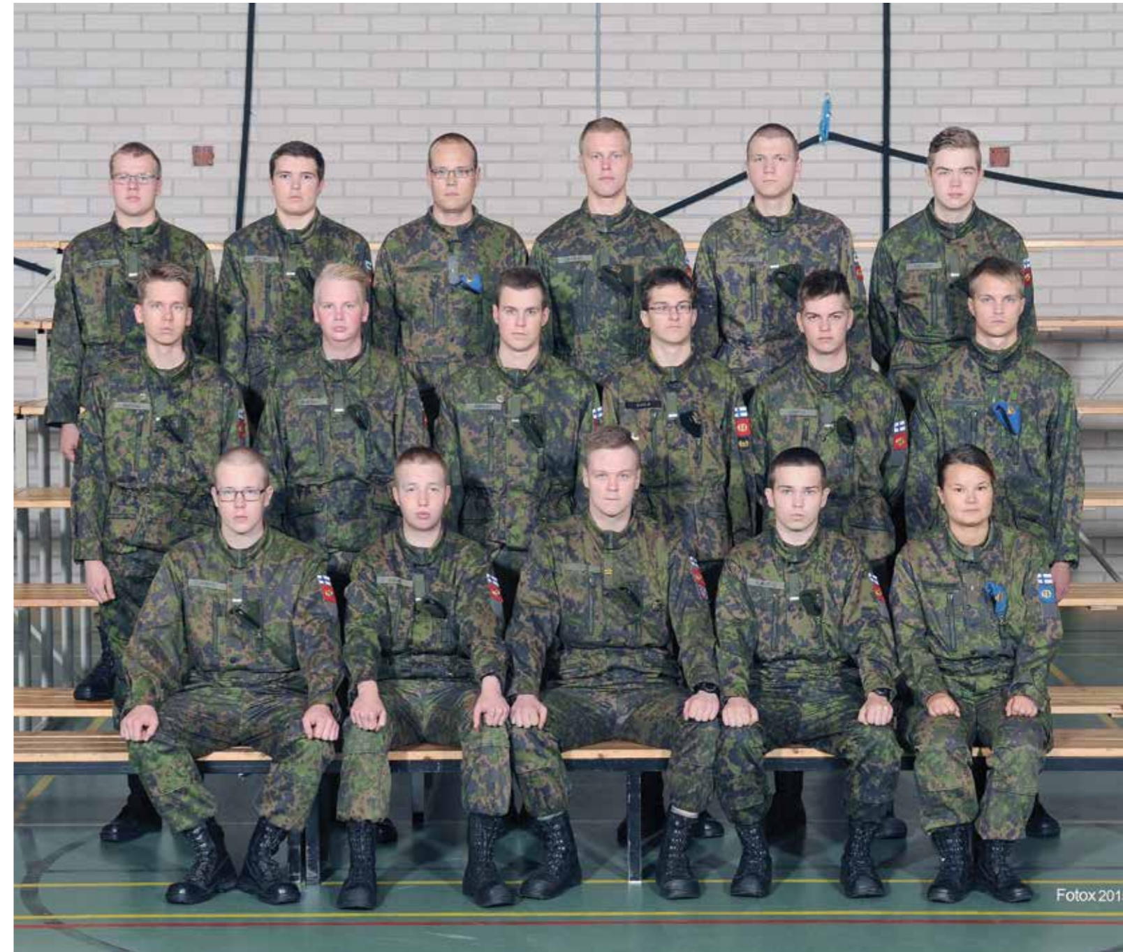
Tulenjohto- ja viestilinja

Olemme valmiita kouluttamaan omia alaisiamme sekä johdopaikan miehistöä takaamaan isänmaamme turvallisuutta.