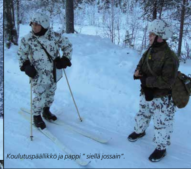
Koulutuspäällikkö ja pappi "siellä jossain".