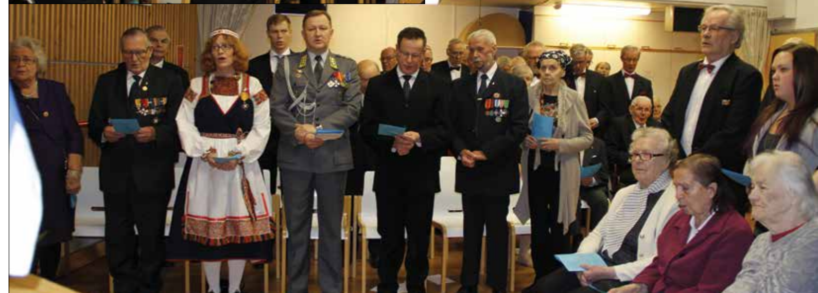
Itsenäisyysjuhla Veljeskodilla Rovaniemellä.

"Me suomalaiset tunnemmekin suurta kiitollisuutta sotiemme Veteraaneja, Lottia ja koko veteraanisukupolvea kohtaan. Me ymmärrämme ketjun, joka ulottuu nykypäivästä viime sotiin saakka. Siihen mahtuu isänmaamme pelastaminen, taloudellisen vaurauden rakentaminen ja hyvinvointiyhteiskunnan luominen. Tämä on arvokas perintö, joka meidän on huolehdittava eteenpäin tuleville sukupolville. Veteraanisukupolvien edustajien tahto, tulevaisuuden usko, epäitsekkyys, rohkeus ja toimeenpanokyky olkoon esimerkkinä myös meille, jotka luotsaamme isänmaatamme tämän päivän haasteissa."