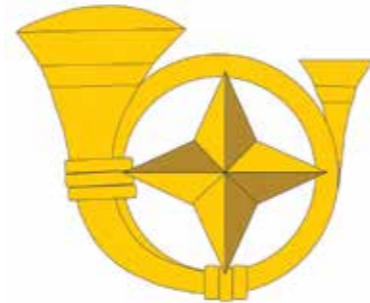
LAPJP:n tunnus vuosina 1967- 1983

Lapin sodan loppuvaiheessa pataljoona oli hetken Torniossa mutta sodan päättyessä Suomen osalta 27.4.1945 pataljoona sijoitettiin Vaasaan. Vuoden 1957 alussa pataljoonan nimi vaihdettiin toisen kerran sen saadessa maakunnallisen nimen muiden jääkäripataljoonien tapaan. Pohjanmaan Jääkäripataljoona (POHMJP) koulutti reippaita jääkäreitä Pohjanmaalla kesään 1964 saakka. Elokuun alussa (2.8.1964) se pyöräili uuteen kotivarsunkuntaansa Sodankylään. Pari vuotta myöhemmin, 1.7.1966, joukon nimi vaihdettiin uuteen kotipaikkaan sopivammaksi. Tällöin otettiin käyttöön patal-