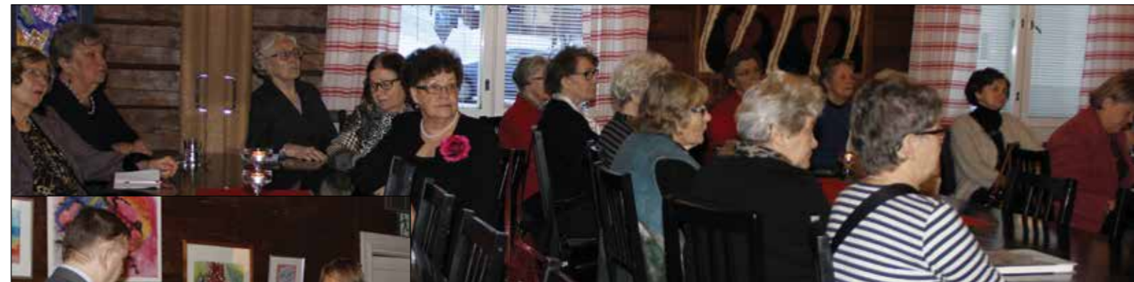
Lapin Lottaperinneyhdistyksen syyskokous pidettiin Rovaniemellä.