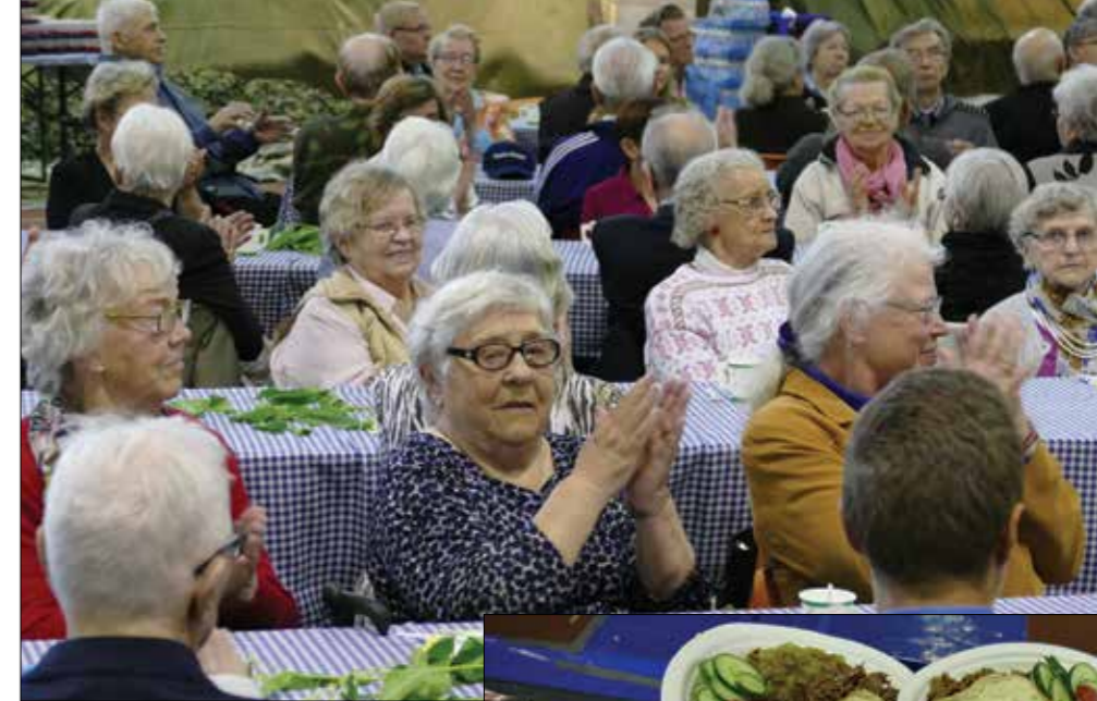
Herkulliset aterialautaset täyttyivät lentoemäntien, sotilaskotisisarien ja Lady Lions'ien hyvällä yhteistyöllä.