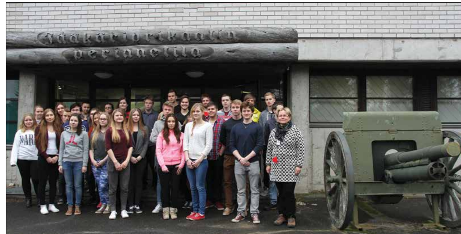
Sodankylän lukion abiturientit vierailivat Jääkäriprikaatissa 19.10.2015.