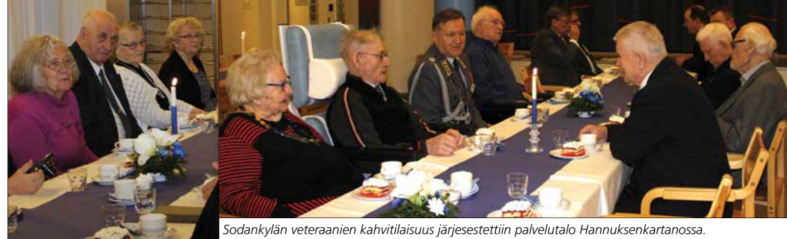
Sodankylän veteraanien kahvitilaisuus järjestettiin palvelutalo Hannuksenkartanossa.