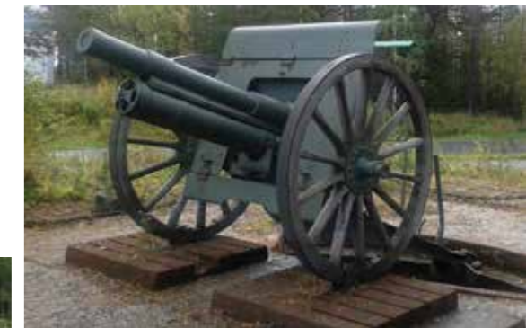
Lapin sodan tykistön muistomerkki Tornion taisteluiden aikana muistomerkkin paikalla oli IIKTR 16:n tuliasema. Muistotykki 876/K02 on ollut mukana Tornion taisteluissa. Sillä ammuttiin ensimmäiset laukaukset 6.10.1944 Heikuransaa- ren suuntaan.

Osa retkeläisistämme kävi myös itse ulkomailla, tällä kertaa Japan. Kaikki palasivat myös sovittuun aikaan mennessä takaisin ja sen jälkeen suuntasimme linja-auton keulan kohti Rovaniemeä, jonne saavuimme alkuillasta. Matka oli erittäin onnistunut ja täytti kiitettävästi ainakin allekirjoittaneen toiveet ja odotukset.