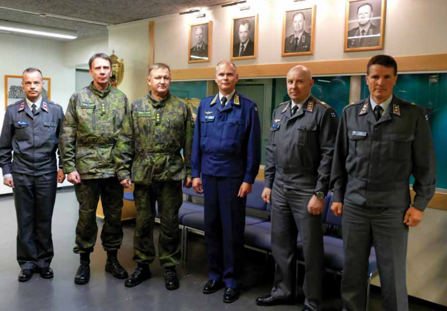
Puolustusvoimain komentaja kenraali Jarmo Lindberg tarkasti Jääkäriprikaatin 22.9.2015.