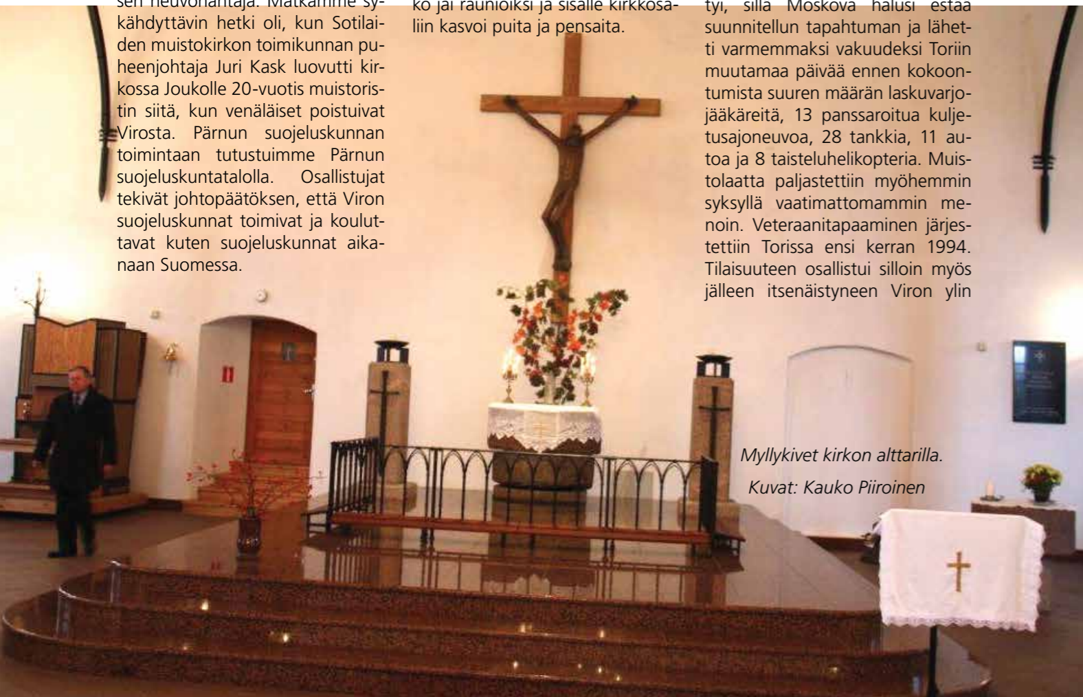
Myllykivet kirkon alttarilla.