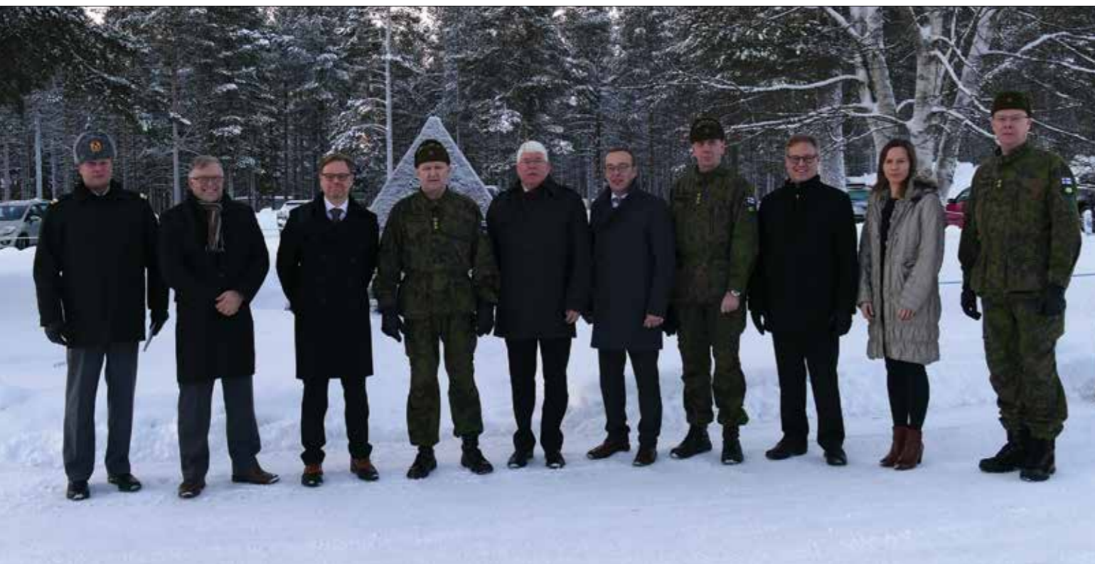
Puolustusministeriön hallintopoliittinen osasto teki puolustusvoimauudistuksen toimeenpanoon liittyvän seurantakäynnin Jääkäriprikaatiin 8.-9.12.2015.