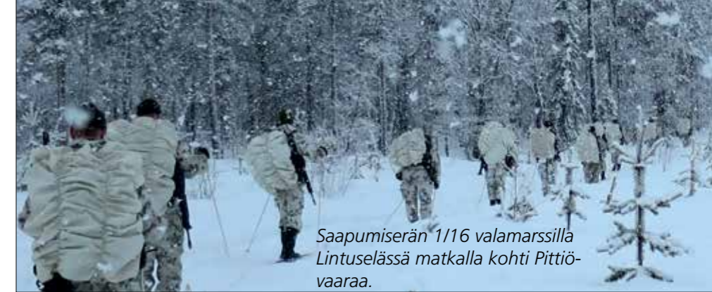
Saapumiserän 1/16 valamarssilla Lintuselässä matkalla kohti Pittiövaaraa.

tulipalo sammutetaan. Hyvä olisi ollut käydä seuraamassa edes yksi marssi, ennen kuin tapahtuma tuomittiin. Pääsääntöisesti kaikki marssille lähteneet sen myös kunnialla läpäisivät, jolloin tapahtuma ei millään voinut olla liian vaativa. Oikein toteutettuna pitkäkin marssi on läpäistävissä. Vanha sanonta, ei matka tapa, vaan vauhti, antaa hyvän perustan suunnittelulle.