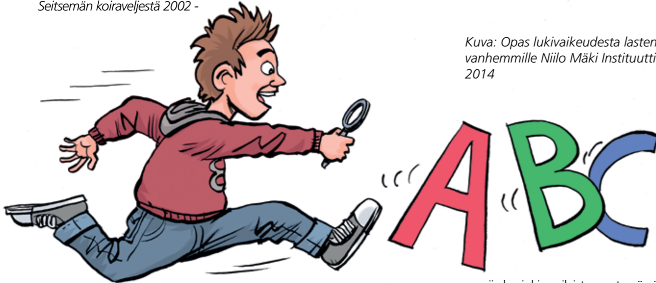
Kuva: Opas lukivaikkeudesta lasten vanhemmille Niilo Mäki Instituutti 2014

”Lukkarin väkivuossa pöydän ympärillä istuivat sitten veljet. Aal vaakkui lukkari. Aa toistivat veljet yhteen ääneen. Lukkari oli jo kaksi päivää yrittänyt opettaa Jukolan veljeksille kirjaimia, mutta huonolla menestyksellä. Vaikka hän kuinka rähisi ja huusi, ei oppi ollut mennäkseen poikien paksuun kalloon. Väsyessään hän antoi vuoron pienelle tyttäreilleen. Juhani ja Timo seisoivat yhtenä hapeänurkassa. He eivät olleet päässeet A:ta pidemmälle. Toiset olivat sentään oppineet B:n ja C:nkin, mutta huikean poikkeuksen teki Eero, joka harjoitteli jo oikein vikkellä tavaamista.” - Mauri Kunnas Seitsemän koiraveljestä 2002 -