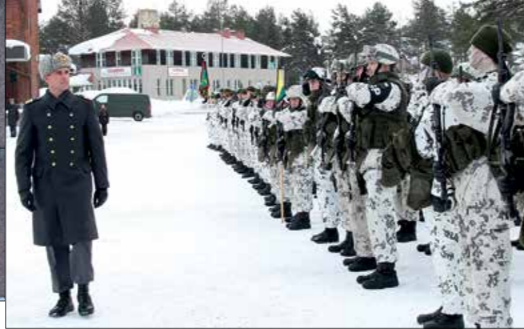
Paraatikselsmus Sodankylän keskustassa.