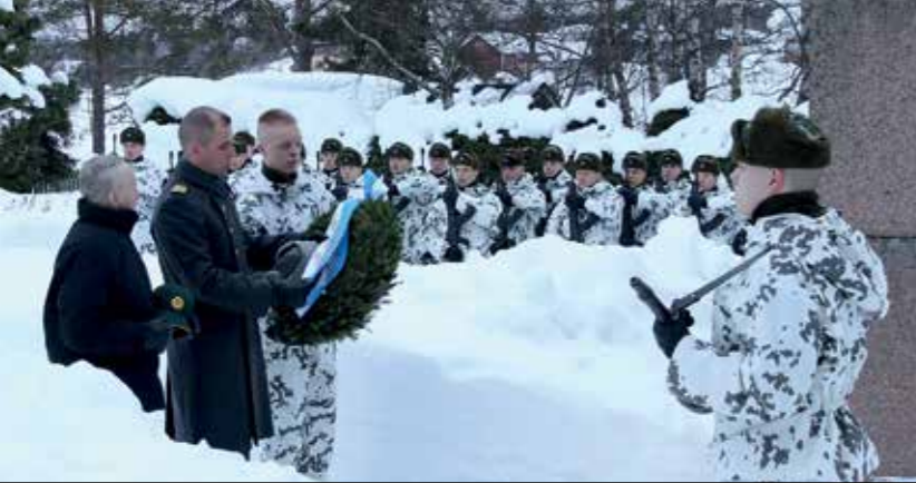
Sankarivainajien muistoa kunnioittaen, Lapin jääkäripataljoona.