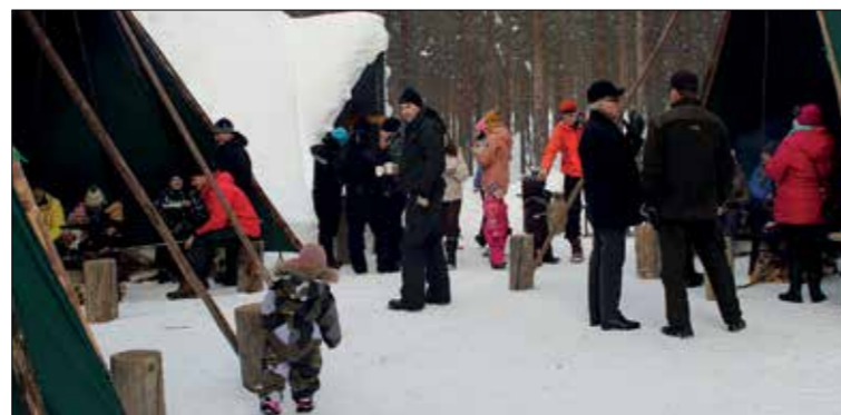
Lisärakenteiden avulla kaikki mahtuivat tulistelemaan.