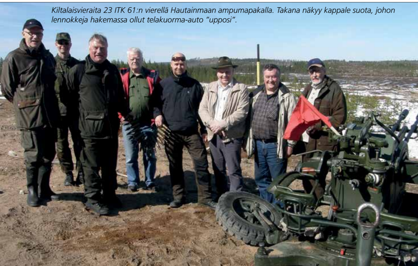
Kiltalaisvieraita 23 ITK 61:n vierellä Hautainmaan ampumapaikalla. Takana näkyy kappale suota, johon lennokka hakemassa ollut telakuorma-auto "upposi".