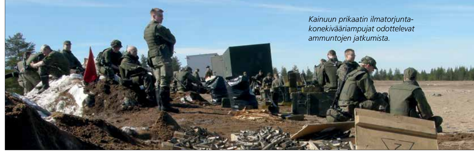
Kainuun prikaatin ilmatorjuntakonekivääriampujat odottelevat ammuntojen jatkumista.

Koska taisteluumunnoissa oli vierailumme aikana tauko, onnistui tutustuminen organisaatioon, aseisiin ja eri taisteluvälineisiin