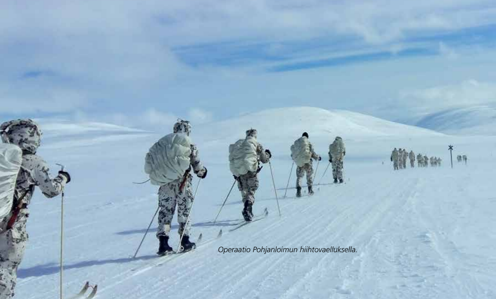
Operaatio Pohjanloimun hiihtovaelluksella.

Prikaatin kokelaiden kanssa vaelimme sotilasvarustuksessa sukset jalassa kolmen päivän aikana kolmen PAK-marssin verran ja nautimme käsivarren upeista maisemista. Operaation tuki- ja järjestelyorganisaatio toimi kiitettävästi ja huolto pelasi. Toivottavasti jatkossa kaikki prikaatissa palvelevat upseerikokelaat pääsevät osallistumaan operaatioon.