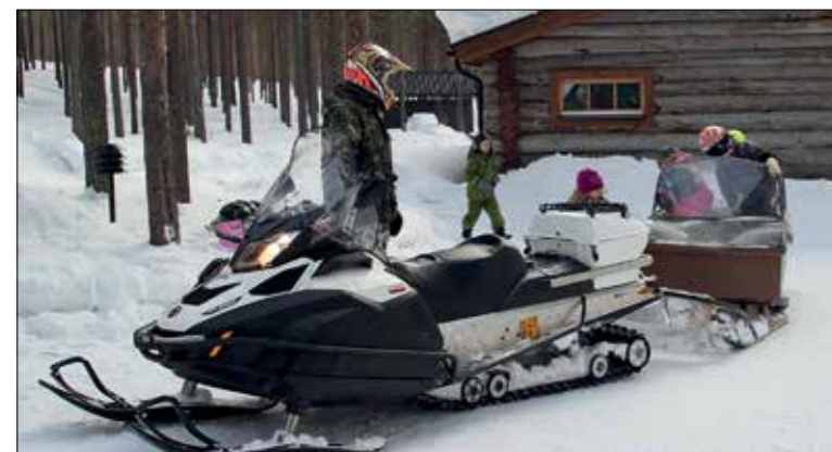
Lasten mielestä paras ohjelma numero.