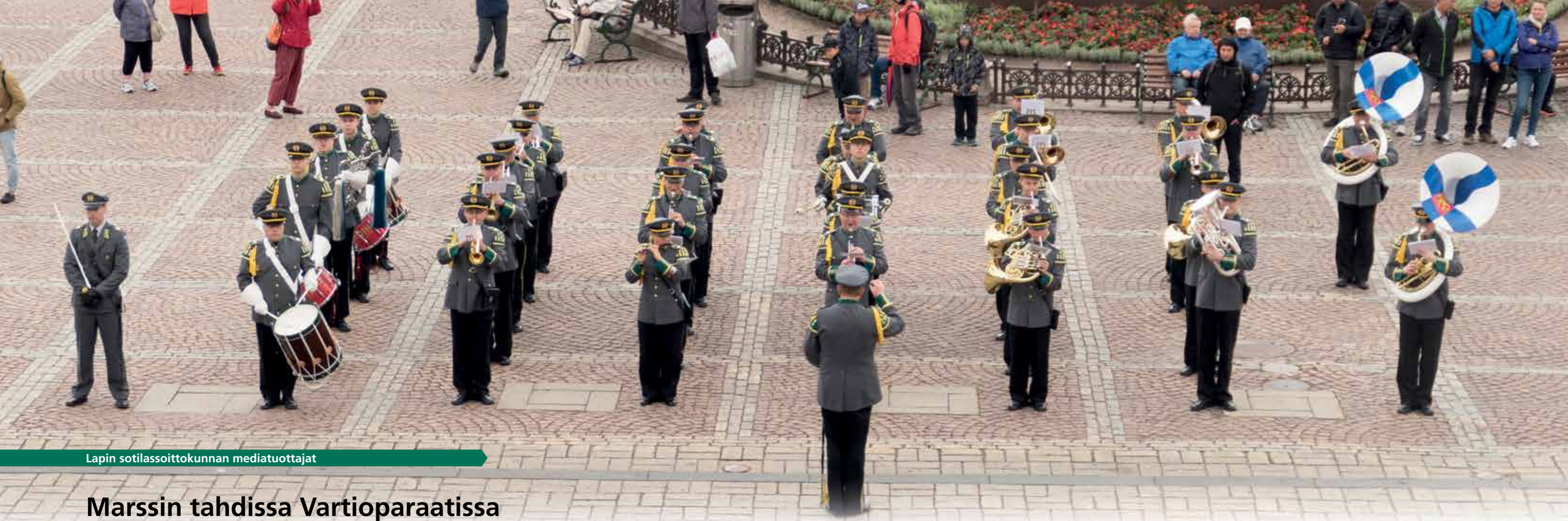
Lapin sotilassoittokunnan mediatuottajat