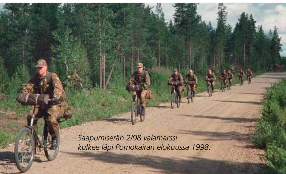
Saapumiserän 2/98 valamarssi kulkee läpi Pomokairan elokuussa 1998.