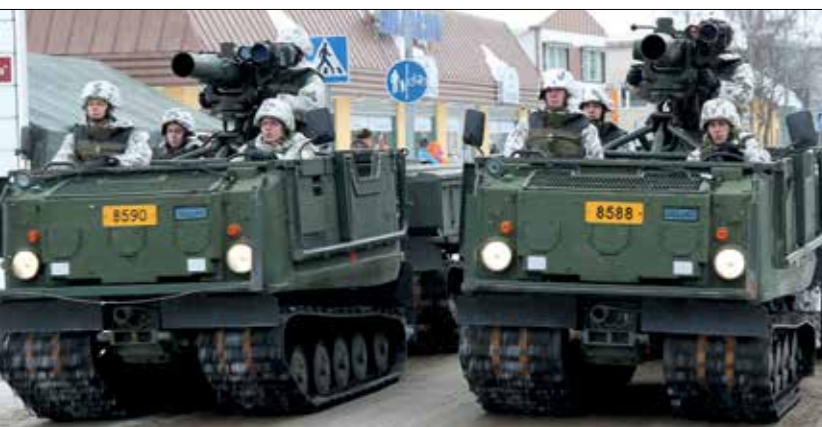
Taisteluosaston tulivoimaa, panssarintorjuntaohjuksia (PSTOHJ83/ TOW2).