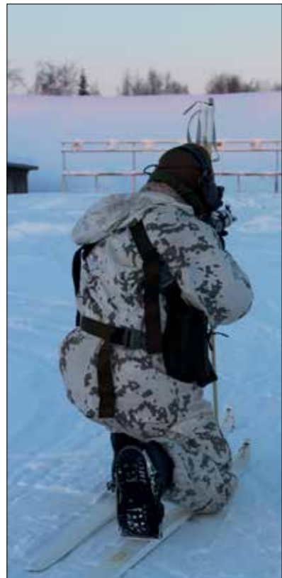
Ammuntaa suksilla. 2015

ta. Nuorelle kurssilaiselle koulutus antaa paitsi tärkeää ammattitaitoa talvikoulutusaiheissa, myös itsevarmuutta kansainvälisessä ympäristössä työskentelyyn vaikka se tässä tapauksessa olisikin vain taistelijaparin tai ryhmän toimintaa.