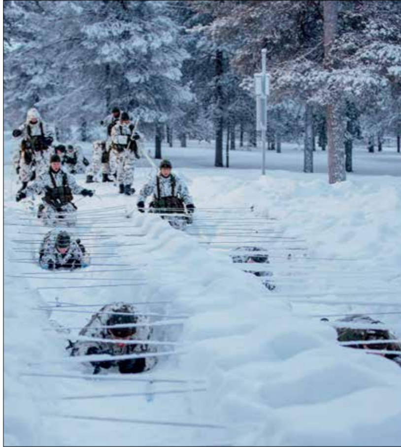
Koulutusta hiihdon taitoradalla. 2016

Tärkein "tuote" vuosina 2014-2016 on ollut Jääkäriprikaatin järjestämä kansainvälinen talvisodankäynnin peruskurssi. Kurssille on osallistunut vaihteleva määrä Yhdysvaltalaisia ammattisotilaita kuitenkin siten, että yli puolet kurssilaisista on joka vuosi ollut suomalaisia ja enimmäkseen Jääkäriprikaatin omia nuoria kouluttajia. Kurssin opetus järjestetään täysin englanniksi joten kouluttajakaartillekin tämä tarjoaa uusia haastei-