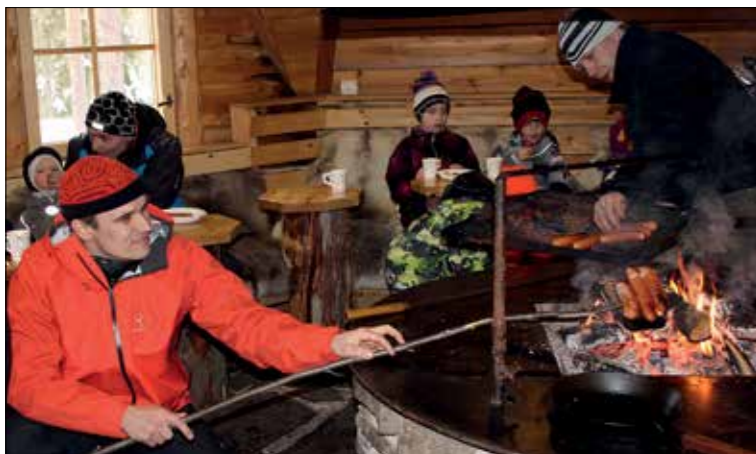
Kodassa oli tiivis tunnelma.