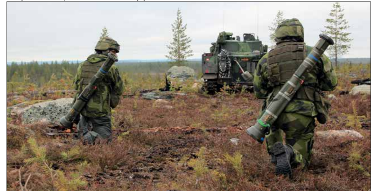
Mekanisoitu jalkaväki hyökkää Naarmantien suunnassa ja KRHK:n henkilökunta sekä varusmiehet antavat koulutusta ruotsalaisvieraille raskaalla heittimellä (120 mm) ampumisesta. 2015/Juha Massinen, JPR.

Varsinainen pääharjoitus järjestettiin Ivaloon tukeutuen mutta talviselviytymiskoulutusvaihe järjestettiin Sodankylässä. Tähän vaiheeseen osallistui italialaisia ja suomalaisia ammattisotilaita. Vajaan viikon mittaisessa harjoituksessa lyhyen peruskoulutusvaiheen jälkeen osallistujat viettivät 3 vuorokautta maastossa niillä varusteilla jota heillä todellisuudessaakin olisi mukana jos lentotehtävä keskeytyy. Pienryhmäkoulutuksena järjestetty koulutus vakuutti osallistujat siitä, että täällä todellakin osataan nämä asiat. Aika näyttää, poikiiko tämä lisää koulutuspyyntöjä eri suunnista?