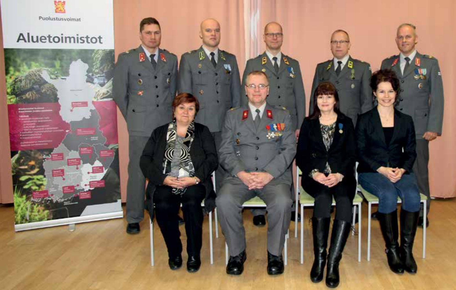
Lapin aluetoimiston henkilöstö.