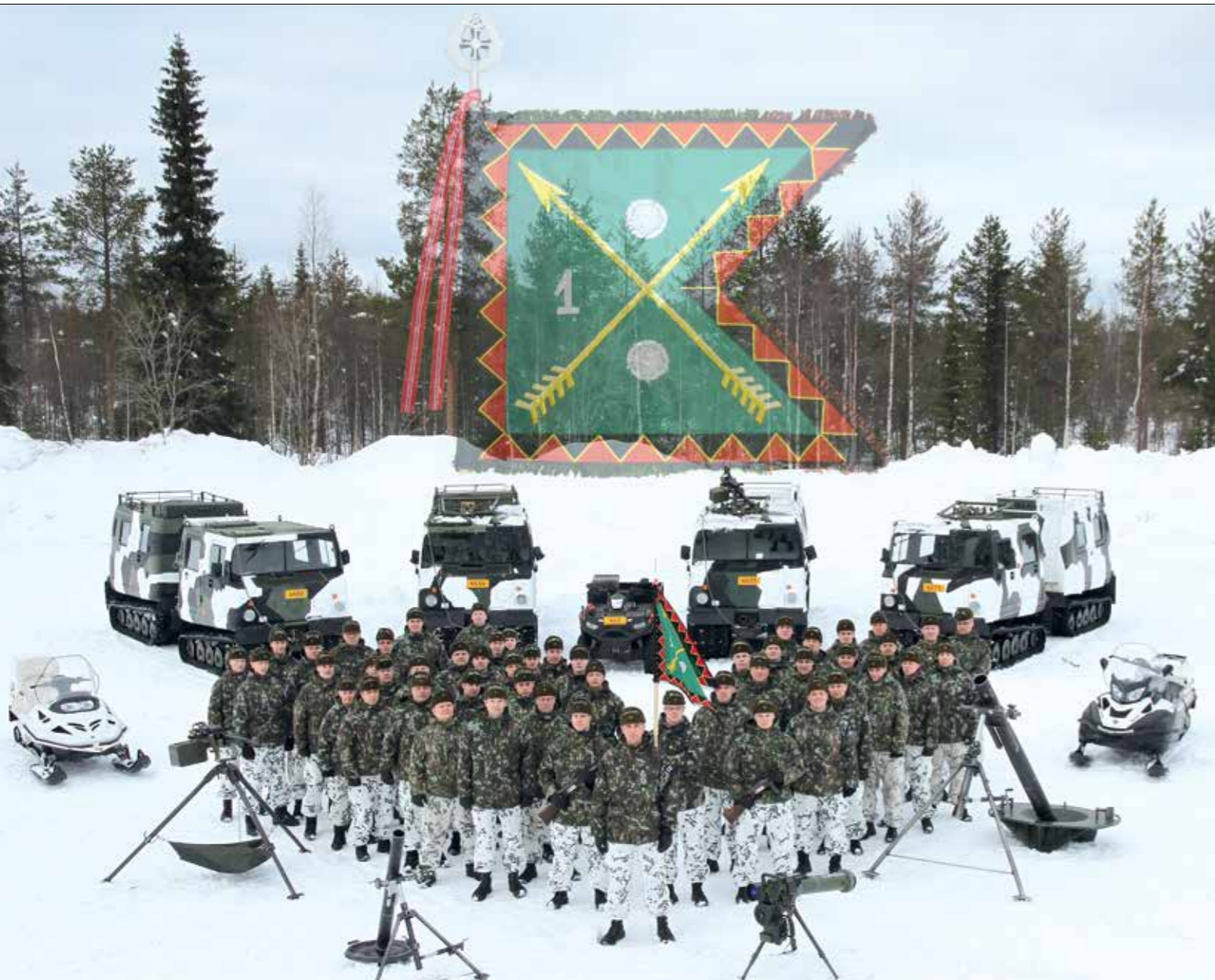
Lapin jääkäripataljoonan henkilökunta