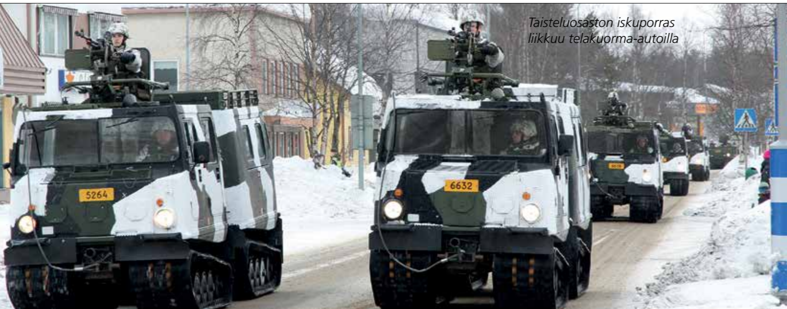
Taisteluosaston iskuporras liikkuu telakuorma-autoilla