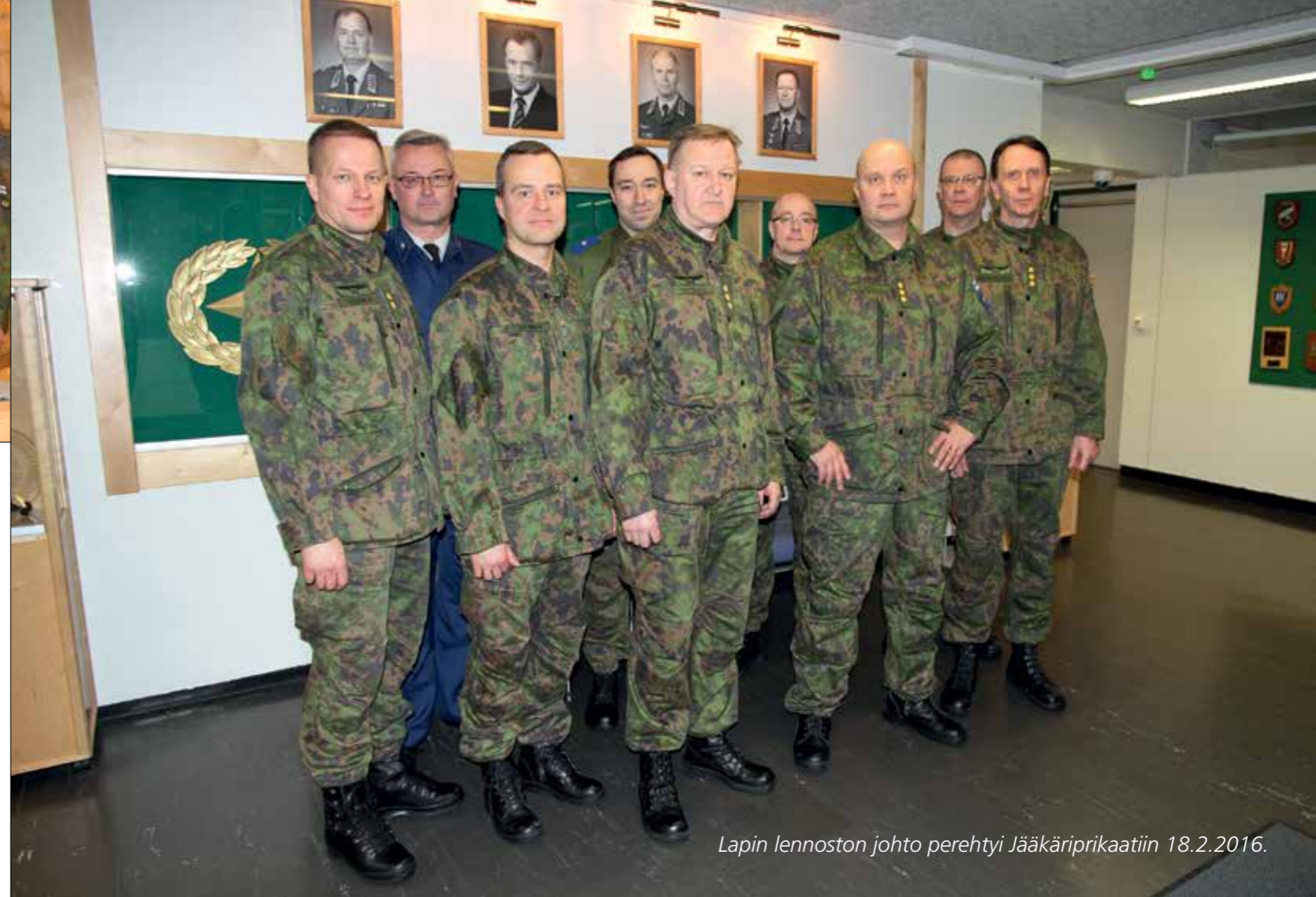
Lapin lennoston johto perehtyi Jääkäriprikaatiin 18.2.2016.