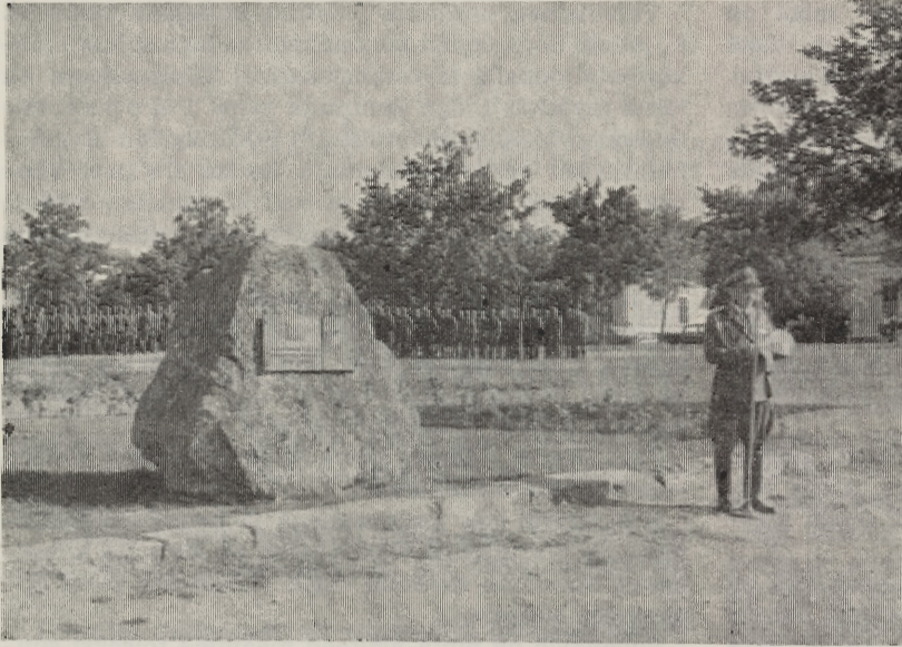
Evl. P. Junttila pitämässä muistokiven luovutustupuhetta Vaasassa 28. 7.