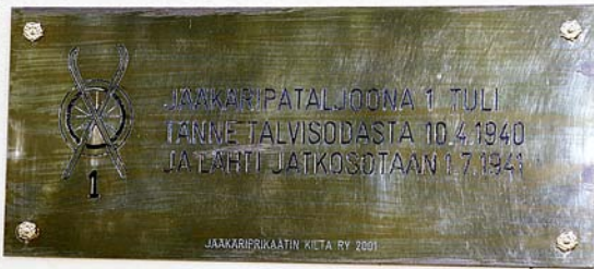
Jääkäripataljoonan 1:n perinnelaatta Lappeenrannan linnoituksen alueelle v. 2001.