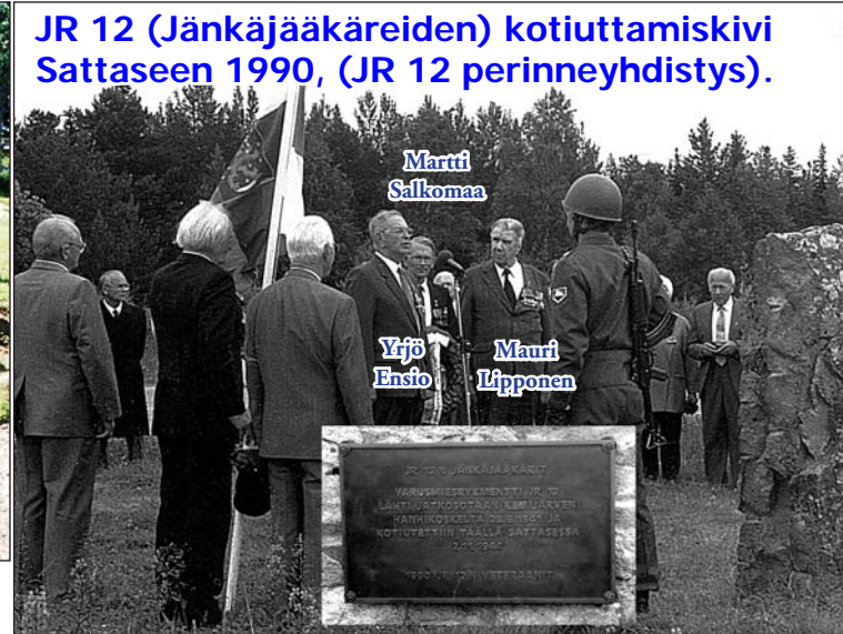
JR 12 (Jänkäjäkäreiden) kotiuttamiskivi Sattaseen 1990, (JR 12 perinneyhdistys).