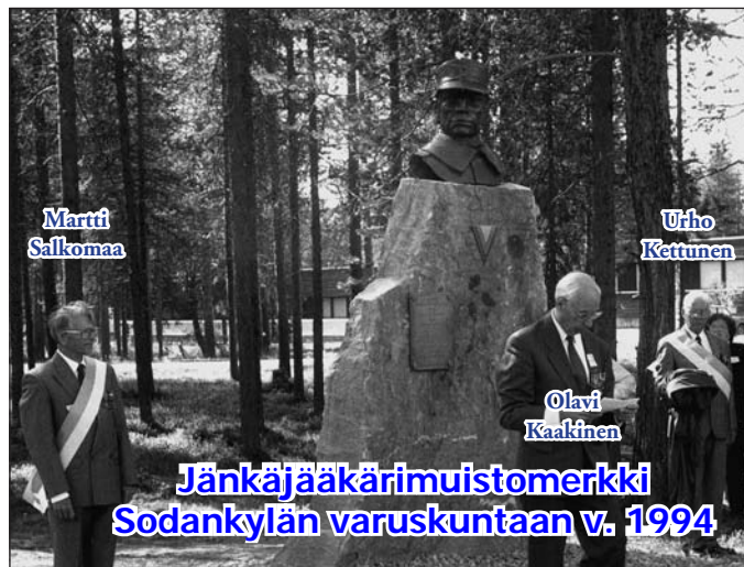
Jänkäjäkärimuistomerkki Sodankylän varuskuntaan v. 1994