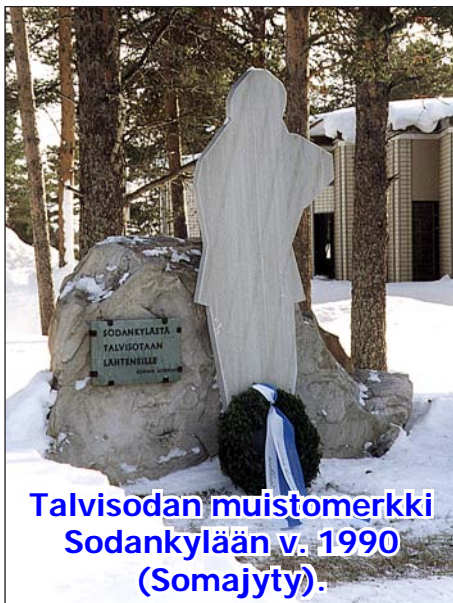
Talvisodan muistomerkki Sodankylään v. 1990 (Somajty).