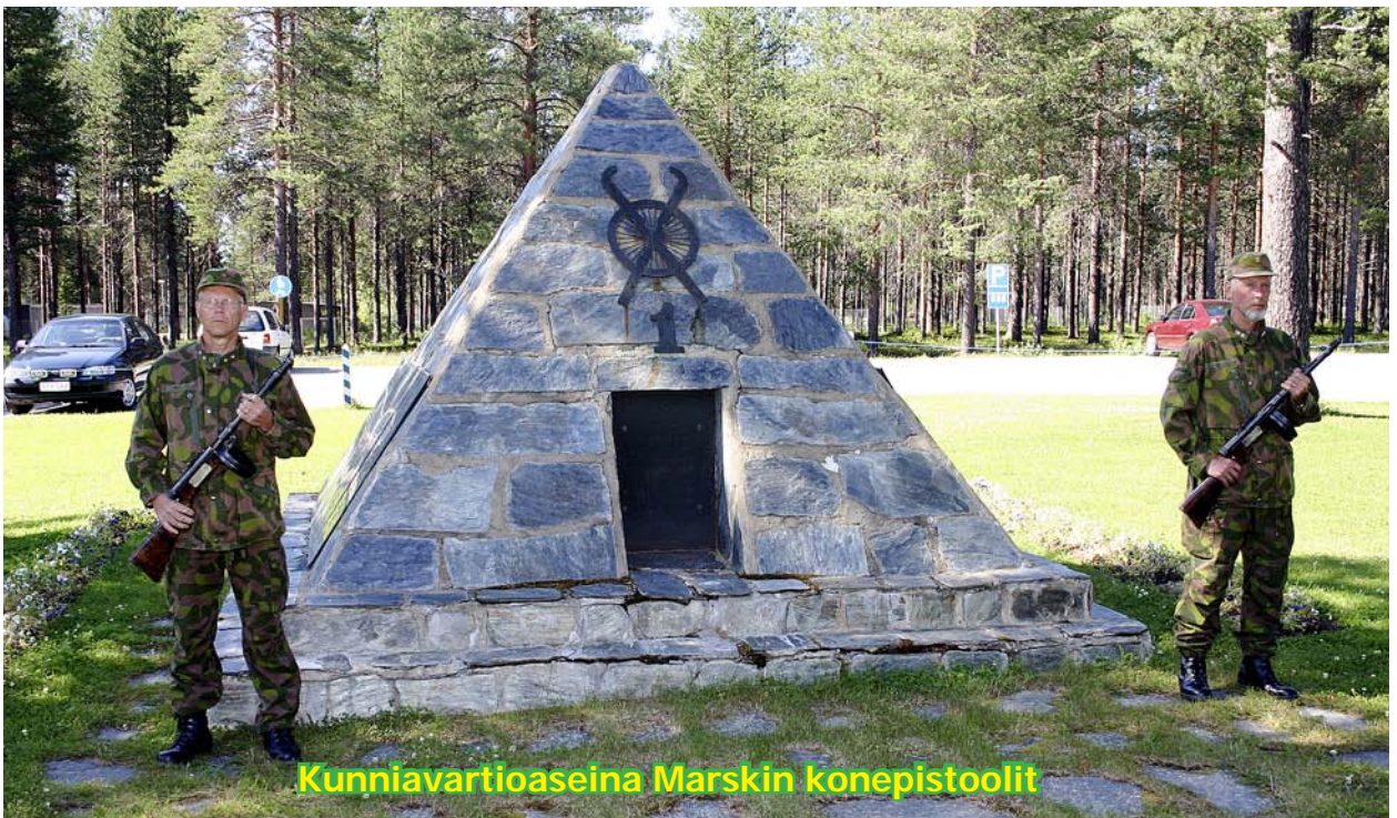
Kunniavartioaseina Marskin konepistoolit