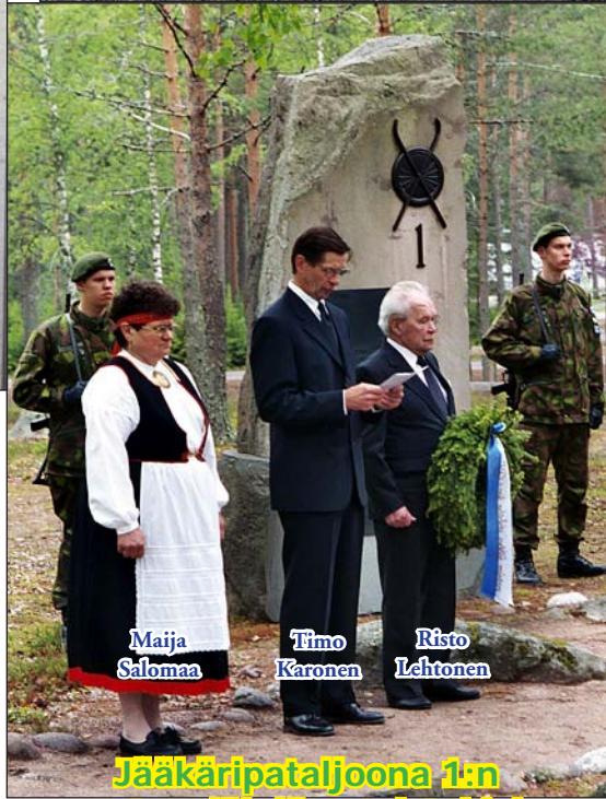
Jääkäripataljoona 1:n sotaanlähden muistokivi Säskylään v. 1995 (Satakunnan osasto).