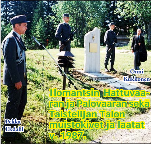
Ilomantsin Hattuvaaran ja Palovaaran sekä Taistelijan Talon muistokivet ja laatat v. 1987.