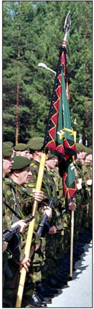
LapJP:n uusittu lippu v. 1987