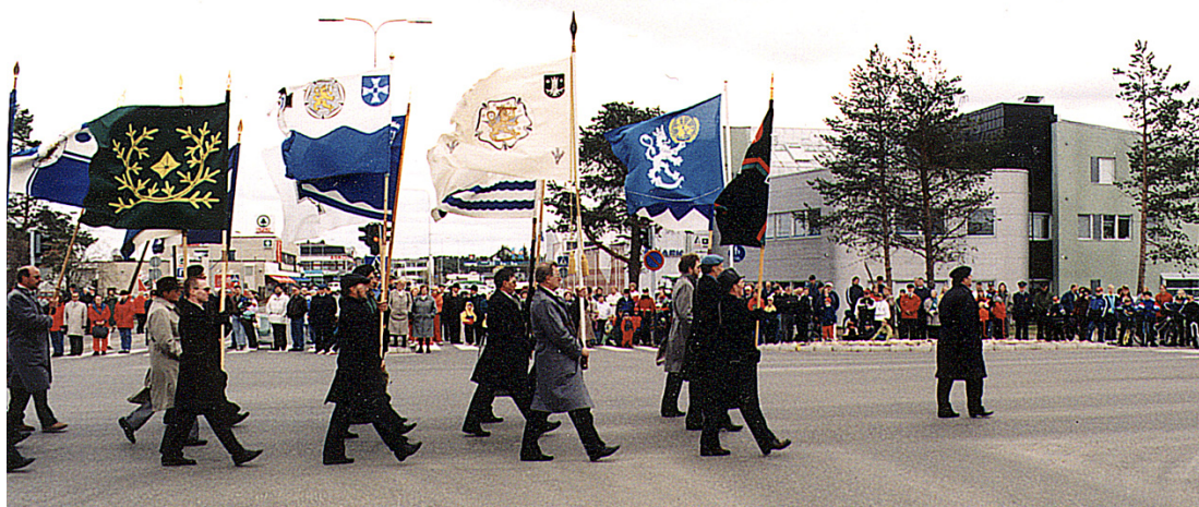
Maanpuolustusjärjestöjen lippulinna Pohjois-Suomen Sotilasläänin paraatissa 04.06.1998 Sodankylässä.